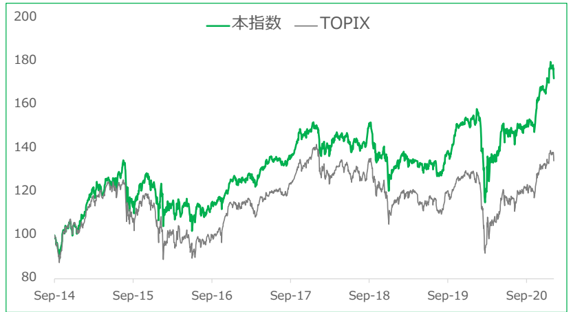
*観測期間: 2014/9/25 - 2020/12/30 「2014年9月25日を100として算出」